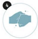
4 Le dessus des doigts