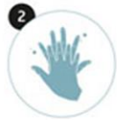
2 Le dos des mains