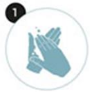
1 Paume contre paume