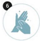
6 Le bout des doigts et les ongles