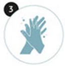
3 Entre les doigts