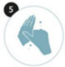
5 Les pouces