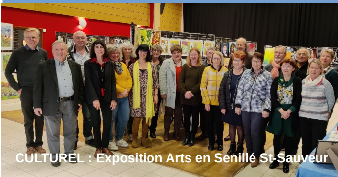
CULTUREL : Exposition Arts en Senillé St-Sauveur