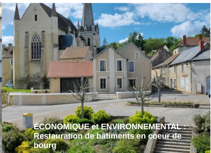
ÉCONOMIQUE et ENVIRONNEMENTAL : Restauration de bâtiments en coeur de bourg