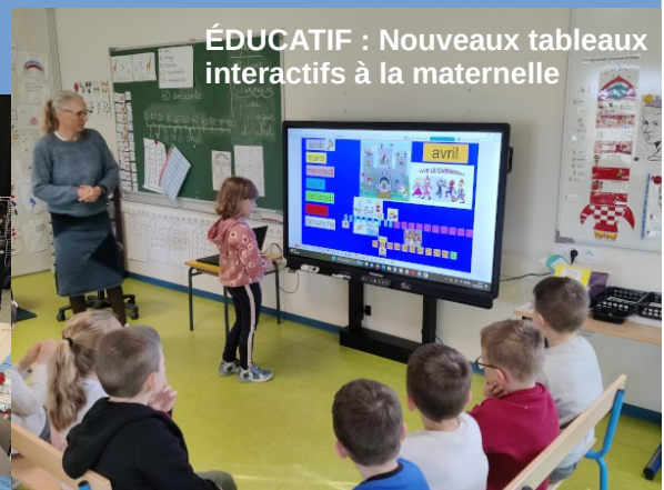
ÉDUCATIF : Nouveaux tableaux interactifs à la maternelle